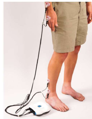
Modélisation corporelle à cinq compartiments